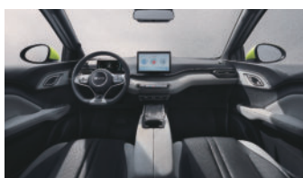
Black and grey